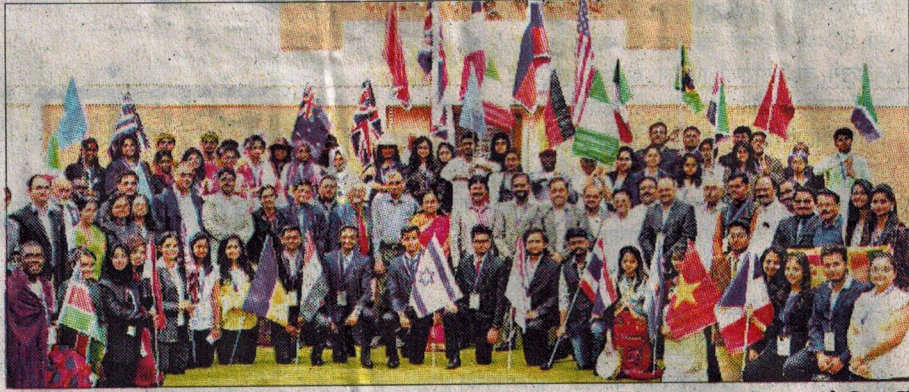
कोल्हापूर : शिवाजी विद्यापीठात आयोजित 'मून-२०१८' मध्ये सहभागी झालेले विविध महाविद्यालयांचे विद्यार्थी प्रतिनिधी.